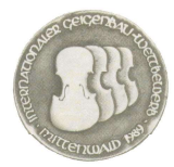
Mittenwald 1989 Cello Silver-medal