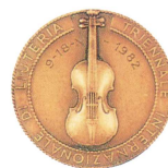
Cremona 1982 Violin Bronze-medal