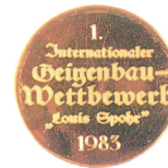
Louis Spohr Kassel 1983 Cello Gold-medal (Tone)