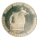
Wiesbaden 1980 Violin Silver-medal